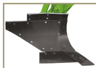
Polietileno (solos argilosos e mistos)