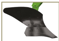
Lisa (solos arenosos)