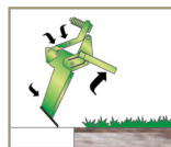
A haste rearra com o levantamento do implemento.