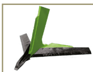
Haste reta (Modelo EBR)