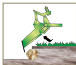
O Shock Control entra em ação e desarma a haste.